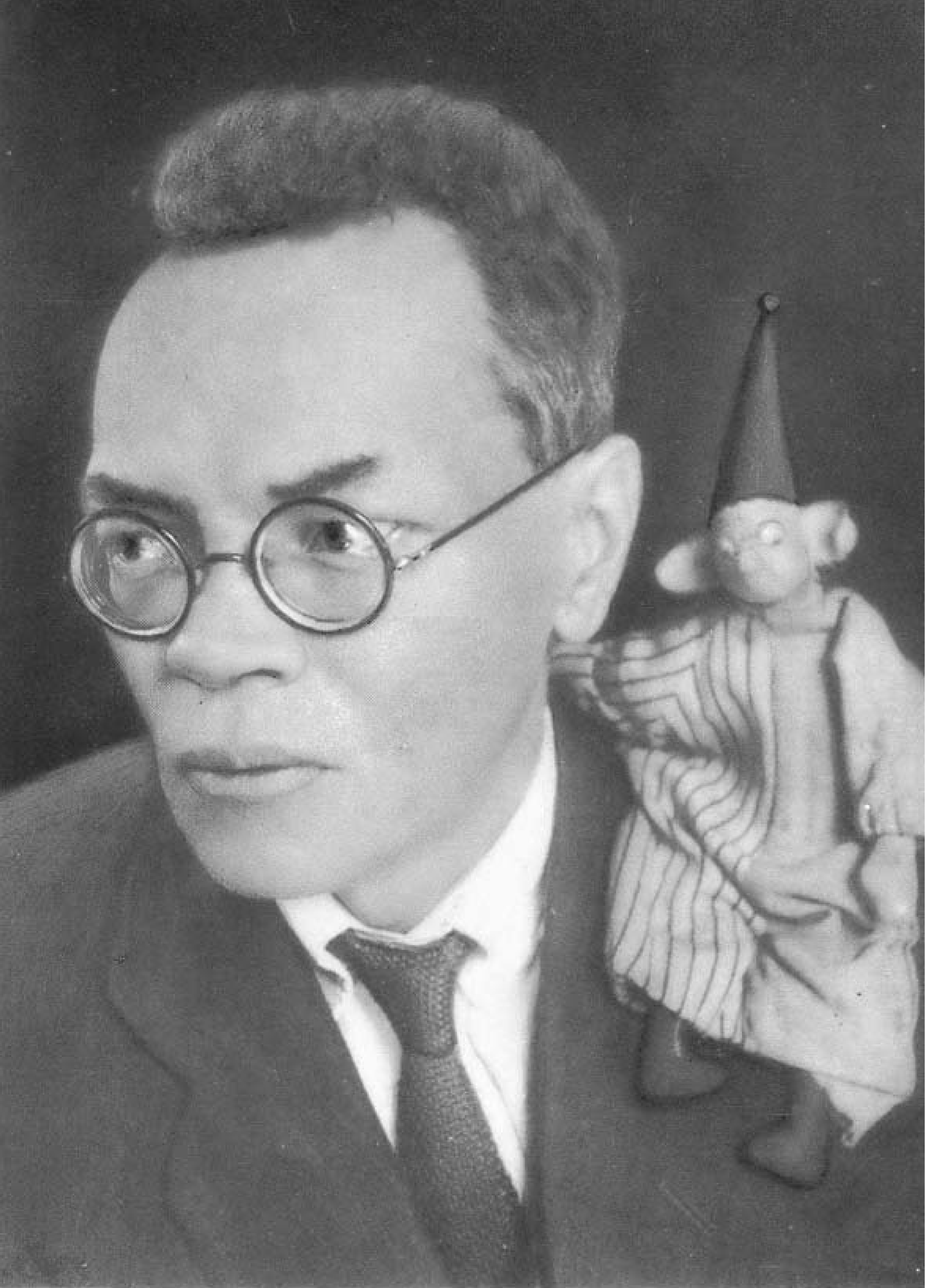
А. М. Ремизов. Берлин. 1923 г.